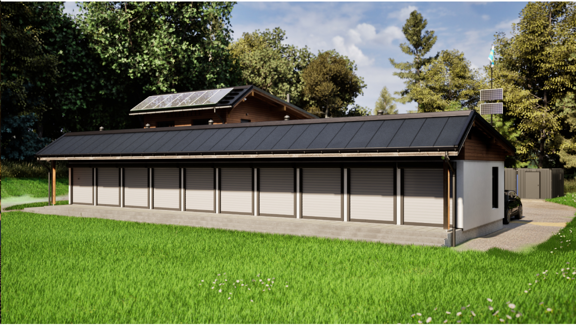
Vizualizace 3 pohled od jihozápadu