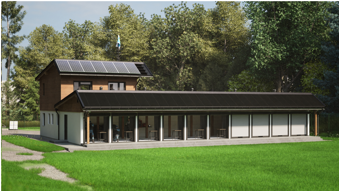
Vizualizace 4 pohled od severozápadu